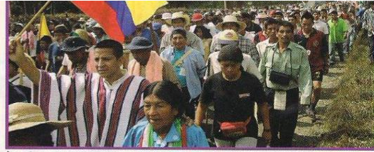
► La desobediencia civil es otra forma de participación.

La desobediencia y la resistencia civil son una respuesta a la injusticia, a la muerte y a la violencia, y constituyen una forma de participación de los ciudadanos pero hay que tener en cuenta que quienes asumen la desobediencia y la resistencia civil, asumen los riesgos y costos de estas acciones.