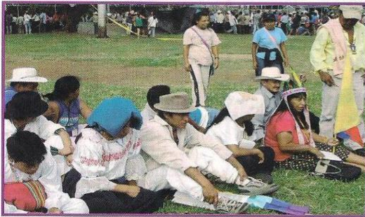
► La protesta pacífica es una forma de desobediencia civil.

Algunas formas de desobediencia civil son: la protesta pacífica, la denuncia de acciones cruentas ante organismos nacionales e internacionales, las jornadas de "protección" civil a bienes públicos como hospitales o colegios, las de rechazo a acciones terroristas, las de repudio por involucrar a niños y niñas en el conflicto, las de resolución alternativa y pacífica de conflictos y las de ratificación del compromiso ciudadano de resistir pacífica y constructivamente.